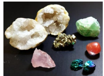
鉱物の色合いには秘密が…