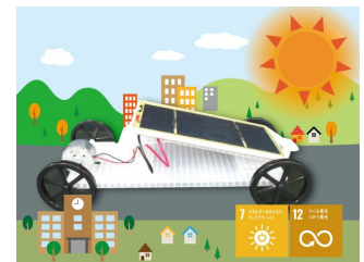
ソーラーカーでSDGsについても考えよう