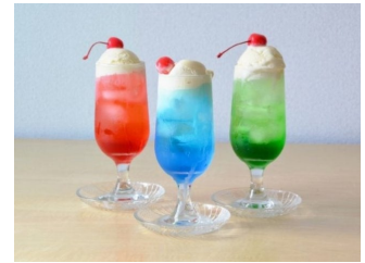
食品サンプルづくり