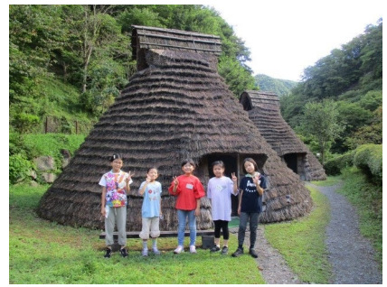
火起こしして魚をつかみ取りして古代の住居でキャンプ！

「サイエンスキャンプ」は、大自然の中だからこそできる大規模な実体験を学びの機会を提供します。化石やガーネット、ヒスイなどを採集しながら地球そのものを体感するテーマや昆虫採集や天体観測や火起こし体験など非日常的な体験を盛り込んだキャンプなど、子どもたちの自己肯定感を育むカリキュラムをラインナップ。また、親子で参加できるカリキュラムも実施してまいります。