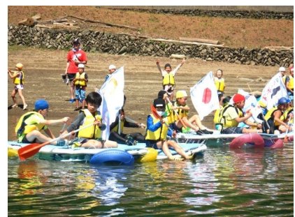
チームで作ったいかだで競争

お子さまに「科学」に興味関心を持っていただくきっかけとして、SDGs（持続可能な開発目標）に関連したテーマや中学受験でも頻出されるテーマなどを取り揃えました。もちろん、自由研究のテーマとして毎年人気があるテーマもラインナップしています。