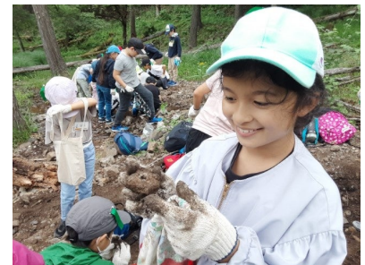
自分で採るガーネットやクリスタルは宝物