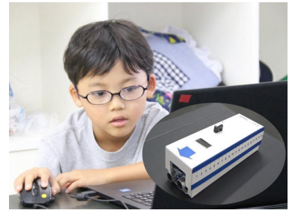
離れたところまでの距離をはかれるデジタルメジャー

「クエスト（探求）プログラム」は、話題の科学的テーマをより集中的に、より深く学ぶことを目的とし、美しい鉱物を科学的な視点で実験観察するテーマ、プログラミングを利用しながら天気予報を行うテーマ、中学受験にも頻出の内容を楽しく学べる-196℃の世界を体験するテーマ、素材の重要性を考える食品サンプルづくり、SDGsの観点で実験をしていくソーラーカーづくりなどのカリキュラムなどをご用意いたしました。